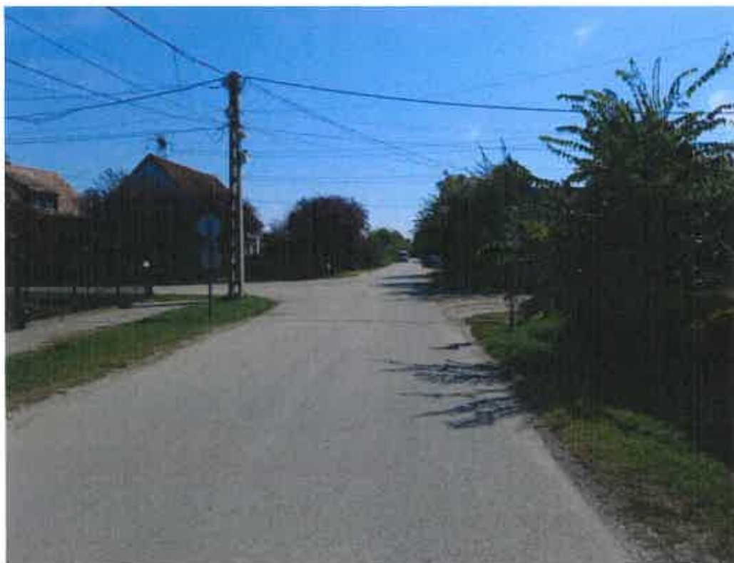
6.d/ Petőfi Sándor utca alárendelt út benőtt növényzet kitakarja a táblát