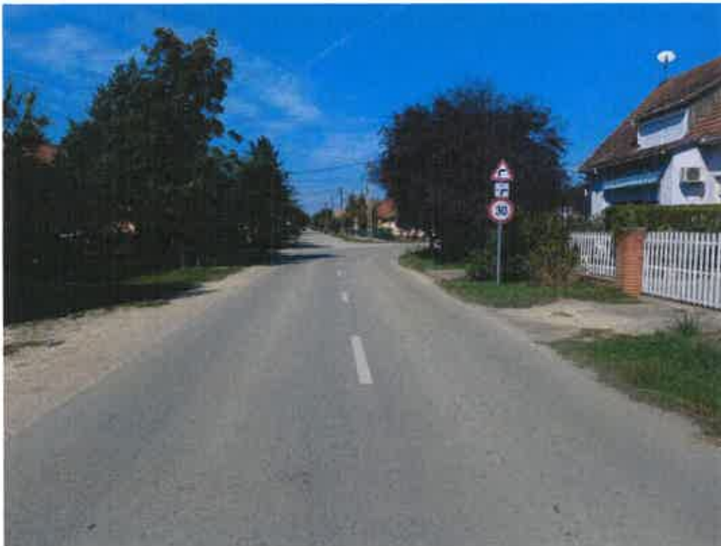
6.a/ Galla tanya főút a Némedi út irányába