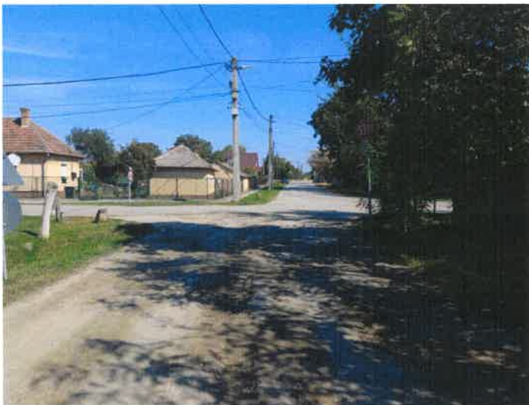
6.c/ Némedi alárendelt út benőtt növényzet kitakarja a táblát