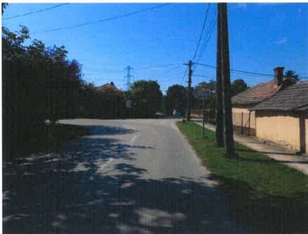
6.b/ Némedi főút a Galla tanya út irányába – áthelyezendő/kiegészítendő tábla –