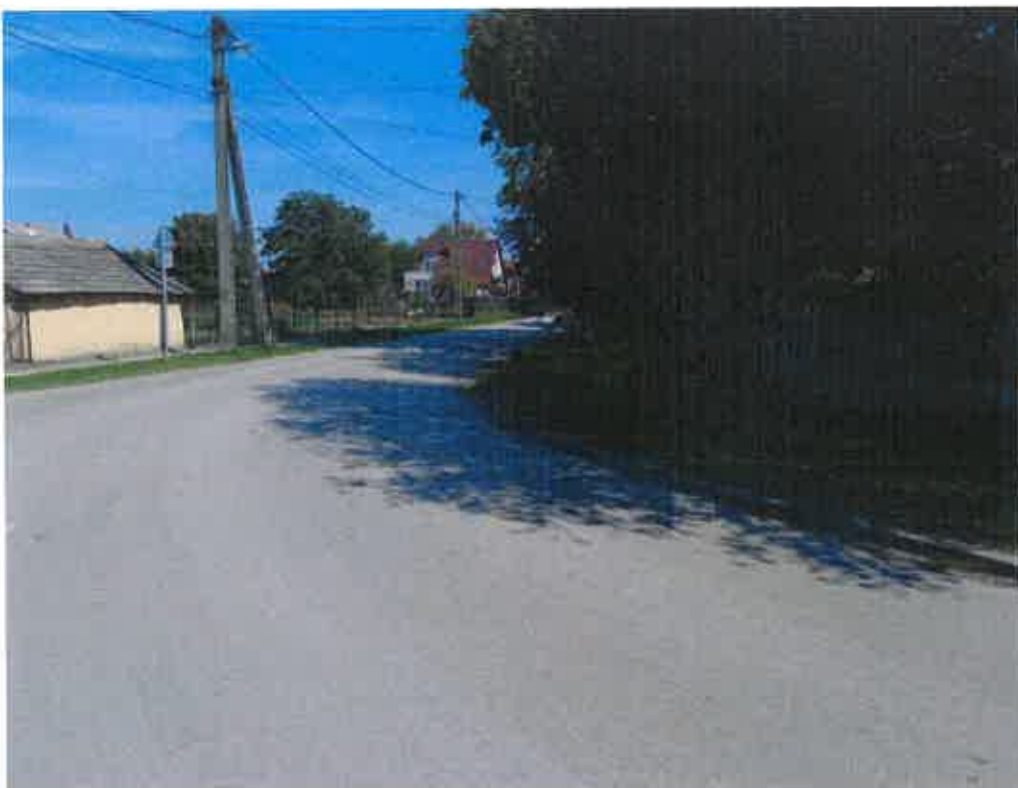
6.e/ Ürszelvénybe lógó fák korlátozzák az útkereszteződés beláthatóságát